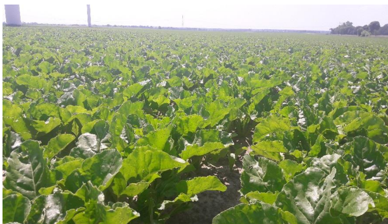
Zdj. 1 Buraki cukrowe w fazie zwierania międzyrzędzi. Pągów (opolskie). 22.05.2018 r.

W celu poprawy pobierania magnezu i siarki z siarczanu magnezu, boru oraz składników ze SmartSil WP/SC do zabiegu zalecamy dodać enzymatyczny koncentrat L-aminokwasów – NaturalCrop SL w dawce 0,5-1 l/ha. Polipeptydy i aminokwasy, zawarte w produkcie stabilizują mieszaninę oraz tworzą na liściu powłokę zapobiegającą parowaniu i wysychaniu cieczy, a aminokwasy chelatujące (glicyna, kwas glutaminowy, histydyna i lizyna) poprawiają pobieranie mikroelementów z mieszaniny.